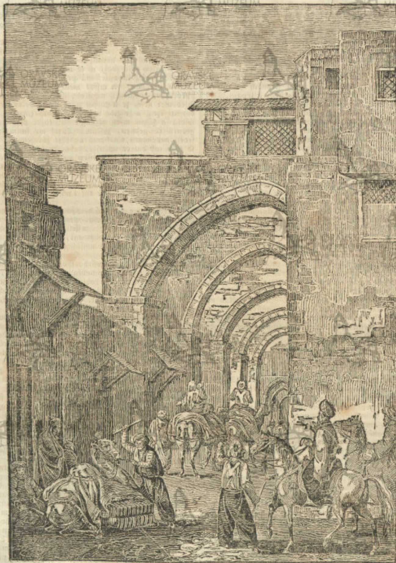
(Wchod do trzyszté w Ale.)

W době krizáckých wálek bylo hlavním přístavem | wané. Leží w aurodné, tu dobu ale puště fragině, Europeců zbrogne na wýchod k dobytí země swatě | a paty hory Skarmel na moři, w zemi Syřské, ted táhnaucej, posleze l. 1291 od Saracenu wybozo- | nedáwno od tureckého Sultána mistrtráli egyptskému